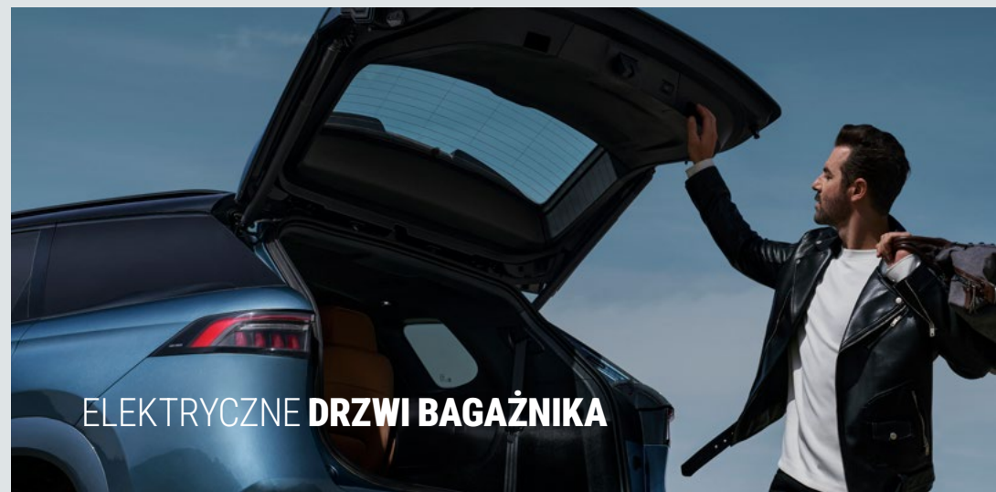
ELEKTRYCZNE DRZWI BAGAŻNIKA