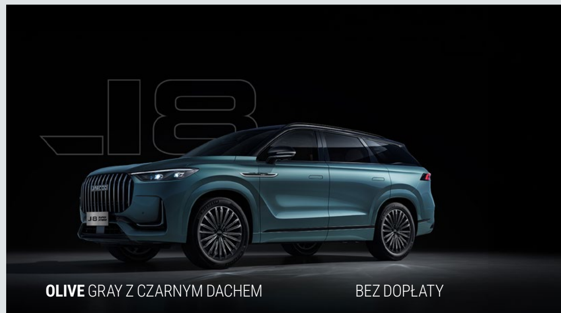
OLIVE GRAY Z CZARNYM DACHEM