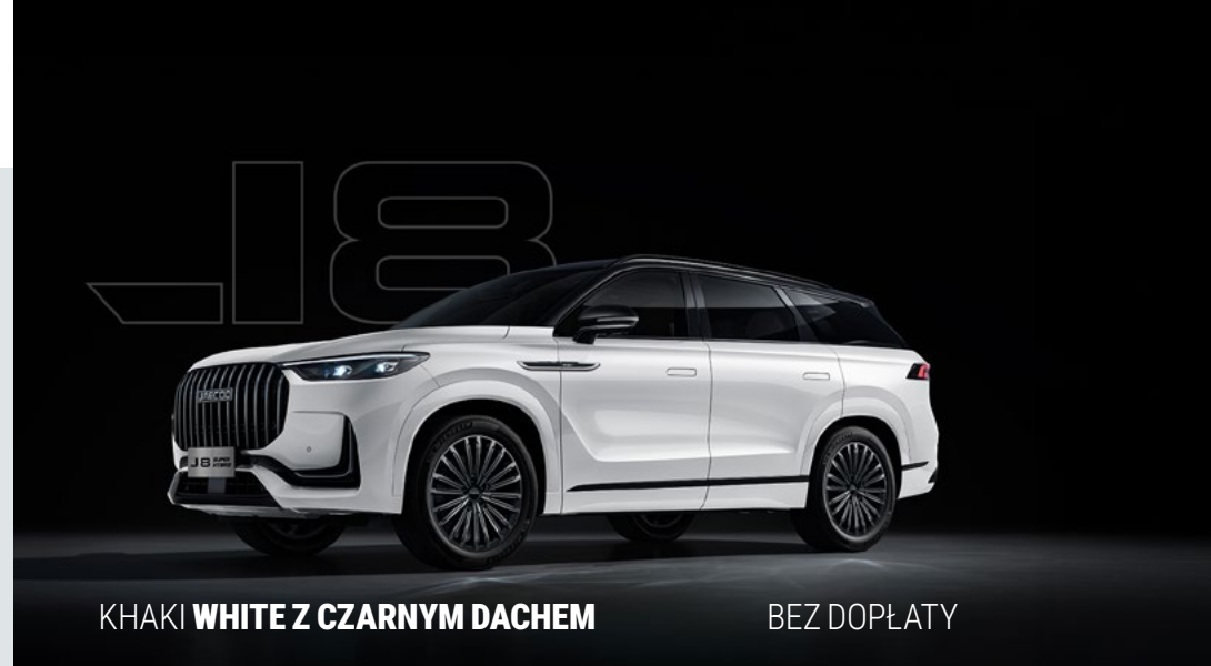
KHAKI WHITE Z CZARNYM DACHEM