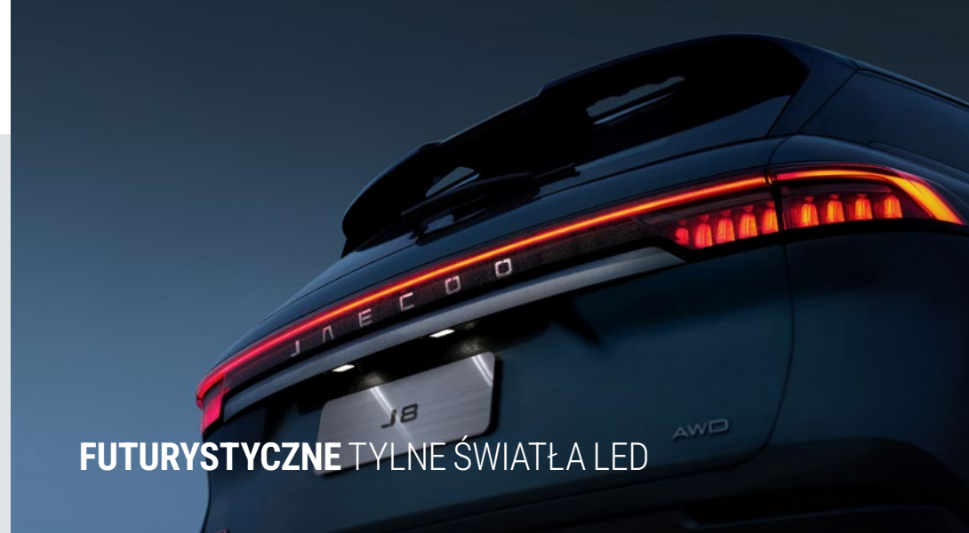
FUTURYSTYCZNE TYLNE ŚWIATŁA LED