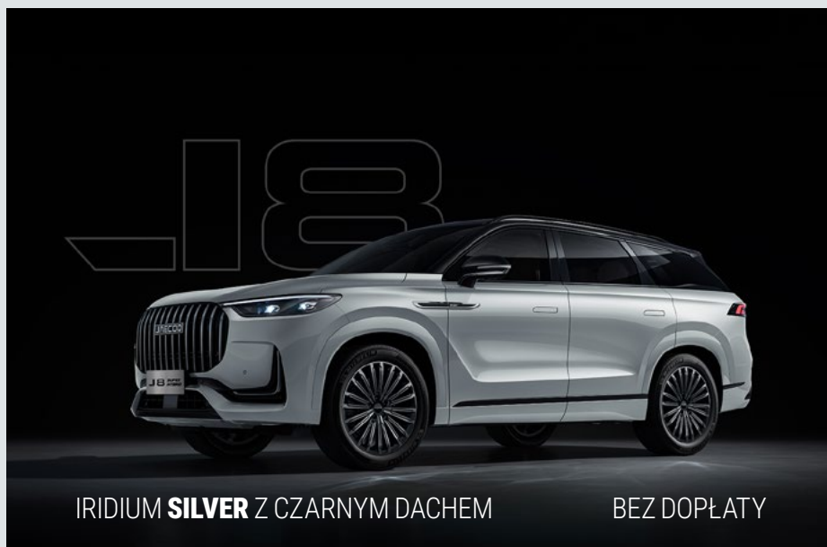
IRIDIUM SILVER Z CZARNYM DACHEM